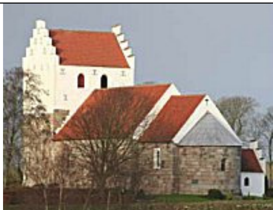
Øster Hornum kirke

Svenstrup kirke er opført i den store kirkebyggetid fra 1150 – 1200. Kirkens ældste dele. skib, kor og apsis er opført af tilhuggede granitsten, lagt på en granitsokkel med skråkant. Højt placeret over Guldbæk Ådal ligger Svenstrup Kirke. Landskab og kirke danner her den smukkeste enhed. Tidligere tiders vigtigste færdselsstrøg mod nord, syd, øst og vest krydsedes nedenfor kirken og mange rejsende søgte herop for en stille stund. Kirken er indviet til Sct. Morten, som er de vejfarendes helgen og beskytter.