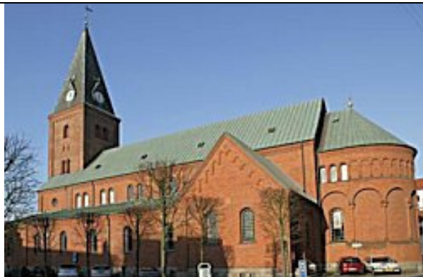
Vor Frue Kirke

Midt i Aalborgs gamle bydel, omgivet af små huse, hæver Vor Frue Kirke sig som en stor og imponerende bygning. Der, hvor kirken ligger har der været kirkegrund helt tilbage til omkring år 1100. Vor Frue Kirke var oprindelig klosterkirke, og lige syd for kirken lå klostret for nonner af Benediktinerordenen. I 1140 blev det norske kongsemne Sigurd Slembe begravet i kirken, hvilket er bevidnet af præsten Kjeld Kalv. Denne præst er den mest navnkundige blandt de præster, der har været ved Vor Frue Kirke, idet han er identisk med Viborgs helgen: Sct. Kjeld.