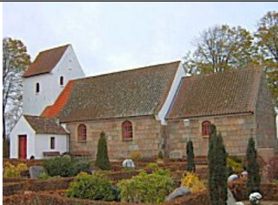
Gl. Hvam kirke

Testrup Kirke og dens omgivelser er et spændende og historisk interessant sted. Indtil 1748 lå her en hospitalskirke. I dag står kun koret og et enkelt fag fra skibet tilbage. Det fungerer som sognekirke for Testrup sogn. Ruinerne af hospitalet kan ses ved kirken. Lige syd for kirken ligger Testrupgaard, og øst herfor ligger ruinerne af et stenhus, der kaldes Testrup Kloster, det er ruinerne af af en stor 3-etages bygning. Bygningen har været administrationsbygning til hospitalet og bolig for biskoppen, når han var på stedet. I 1432 skænkede Viborgbispens sin hovedgård, Testrupgaard, til Testrup Hospitalskirke og sikrede dermed den store kirkes indtægt og vedligeholdelse. Gården, kirken og hospitalet var i middelalderen rammen om et myldrende liv af præster, munke og pilgrimme, der valfartede til kirken og Skt. Søren Helligkilde, der ligger ca. 800 m nordøst for kirken.